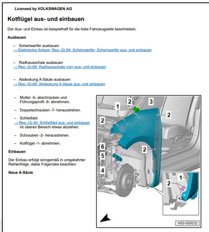
Bild 1: Auszug aus VW Reparaturleitfaden Kotflügel vorne Aus-/Einbauen

Unvollständige, nicht eindeutige oder fehlende technische Informationen in den tagesaktuellen und modellspezifischen Reparaturunterlagen der Fahrzeughersteller und Importeure führen zu unvollständigen und somit nicht fachgerechten Kalkulationen bzw. Sachverständigengutachten.