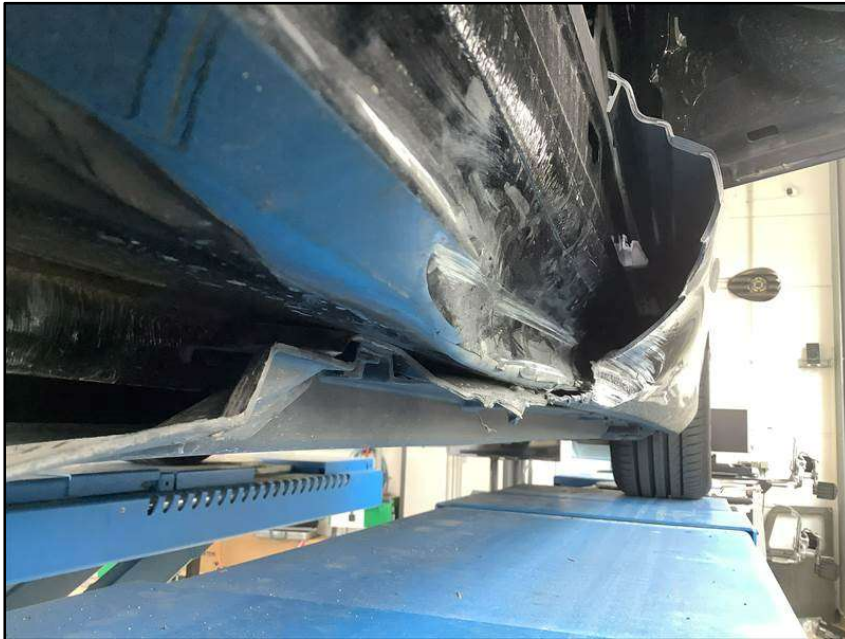
Bild 1: Original Werkstattaufnahme Unfallschaden Schweller (rechts)

Beispiel: Mercedes Benz C-Klasse 206, Unfallschaden am Einstieg bzw. Schweller (rechts). Beschädigte Bereiche/Teile: Längsträger Außenschale, Beplankung Längsträger, Kunststoff-Schweller-verkleidung,