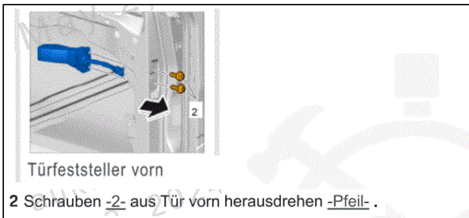
Bild 2: Auszug aus Porsche Reparaturleitfaden RL 575919 Türfeststeller vorne aus- und einbauen (23.03.2024)

Fahrzeughersteller-Informationen: Im Original- Reparaturleitfaden wird dieses Problem nicht erwähnt.